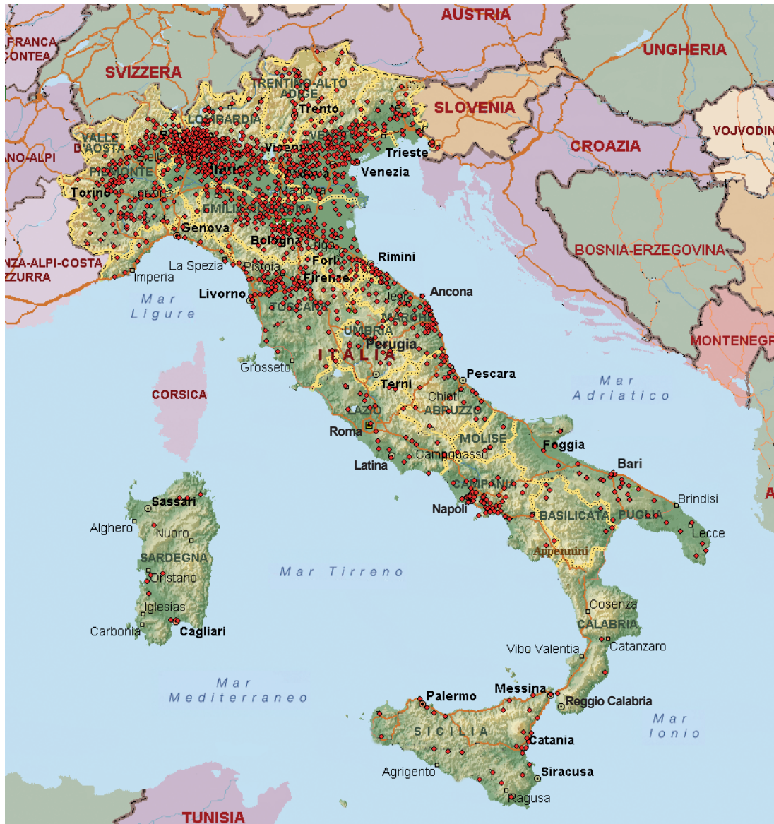
FIG. 1 – LOCALIZZAZIONE DELLE MEDIE IMPRESE INDUSTRIALI ITALIANE NEL 2013